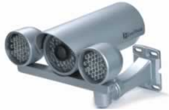
Bild: EZ 550 mit zusätzlichem IR Strahler EIR 100

Spektralbereich: 850 nm Abstrahlwinkel: je 30° (gesamt 30~90° einstellbar inkl. Kamera) Farbe: silber IP Schutzklasse: IP 66 Betriebsspannung: 12 V DC, über EZ 550 Ausgangsspannung Leistungsaufnahme: 17 W max. Umgebungstemperatur: -40°C ~ +50°C Abmessungen (HxBxT): 105 x 130 x 200 mm Gewicht: 750 g Verwendung: mit EZ 550 und EZN 850