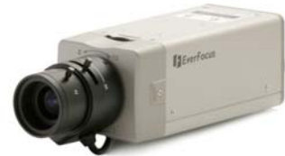
EQ 250 HQ 1/3" digitale Farbkamera, Standardauflösung