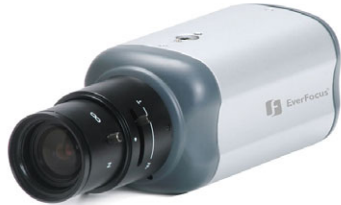
EQ 300 E 1/3" digitale Farbkamera, hochauflösend